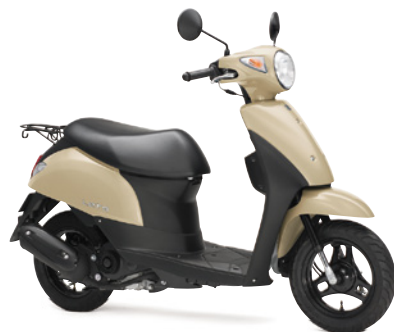
サンディベージュ (PSE)