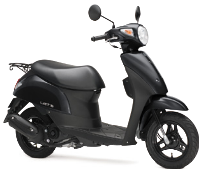
ブラヴォドブラック (W9K)