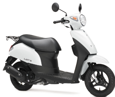
ソリッドスペシャルホワイトNo.2 (30H)

レッツ メーカー希望小売価格(消費税10%込み) ¥178,200 (消費税抜き¥162,000) ■メーカー希望小売価格には、保険料・税金(消費税を除く)・登録などに伴う諸費用は含まれておりません。 ■メーカー希望小売価格は参考価格です。販売価格は各販売店が独自に定めていますので、詳しくは販売店に問い合わせください。 ■メーカー希望小売価格は消費税10%にもとづく価格です。